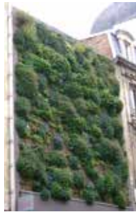
Mur modulaire monobloc Rue de la Veste - Reims